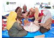
Dapur Umum Tagana Trenggalek Layani Korban Banjir dan Longsor di Empat Kecamatan