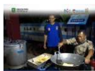
Tagana Trenggalek Dirikan Dapur Umum, 2.000 Porsi Makanan Didistribusikan ke Warga Terdampak Banjir dan Longsor