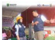
TAGANA Trenggalek Dirikan Dapur Umum untuk Korban Longsor di Desa Depok, Bendungan