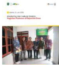
Jawa Timur 2025 Monitoring dan Evaluasi Berkala Kegiatan Puskesmas di Sejumlah Desa