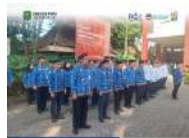
Dinas Sosial PPPA Trenggalek Deklarasi Peringatan Hari Lahir Pancasila