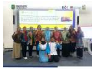
Trenggalek Kabupaten Trenggalek Dinas Sosial Perempuan Anak Pemberdayaan PPA Award 2025