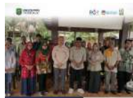
Wali Kota Trenggalek dan tim yang terdiri dari Kepala Dinas Sosial, Dinas Pendidikan dan Kebudayaan, Dinas Kesehatan dan Dinas Perikanan dan Kelautan