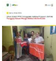
Dinas Sosial PPPA Trenggalek melalui Program GERTAK Tanggap Aduan Warga Melalui Media Sosial