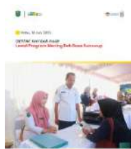
Gerakan Kembali Hadir Lewat Program Mening Deh Desa Sumurup Kecamatan Bendungan