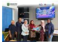
Pengalangan Bantuan Modal Usaha Melalui Program KIP, FPM, JAWARA, KPM, JAWARA, Dan PPPA Jember