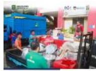
Hari Ketiga Dapur Umum Tagana Trenggalek Layani 1.500 Porsi Makanan untuk Korban Banjir dan Tanah Longsor