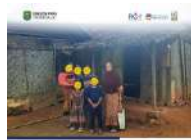
Desai Kemasyarakatan (DK) sebagai PKK di Kecamatan Trenggalek, Turun langsung menuju Desa Mase