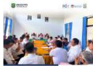
Rapat Dialog Kinerja Dinas Sosial PPPA Kabupaten Trenggalek