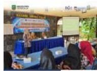
Dinas PPPA Trenggalek Gelar Pelatihan Perencanaan Penganggaran Responsif Gender (PPRG) di Kecamatan Pogalan, Selasa, 24/6/2025