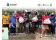
Tagana Trenggalek Distribusikan Bantuan untuk Korban Bencana Banjir di Kabupaten Trenggalek