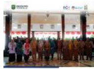
Peringatan Hari Anak Nasional 2025 di Trenggalek, Dengan Peringatan dan Peringatan Anak 41 Tahun