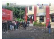
Dinas Sosial PPPA Trenggalek Deklarasi Bersih-Bersih Peringatan Hari Lingkungan Hidup Sedunia 2025