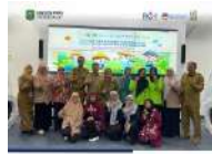
Desa Gemaharjo Jadi Nominatur Nasional Lomba Inovasi Desa Ramah Perempuan, Peduli Anak dan Pendidikan Tahun 2025