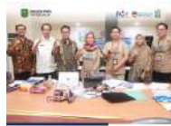
Dinas PPPA Trenggalek Paparkan Inovasi LADIS FEST pada Inatek Award Jawa Timur 2025