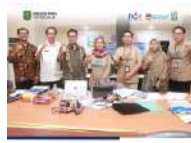
Dinas PPPA Trenggalek Paperless Inovasi LADIS FEST pada Inotek Award Jawa Timur 2025