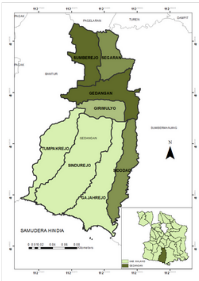
Peta administrasi dan lokasi Gedangan

Gedangan adalah kecamatan yang terletak di karst atau perbukitan kapur Malang selatan yang kering. Pesisir selatan Gedangan terkenal dengan pantainya, baik pantai berpasir putih maupun pantai berbatu. Sebagian besar penduduk tinggal di utara dan tengah kecamatan, sedangkan bagian selatan terutama pesisirnya jarang dihuni. [4] Gedangan banyak ditanami komoditas seperti tebu dan kelapa , sedangkan bagian selatannya diusahakan untuk produksi udang dan garam . Masyarakat di