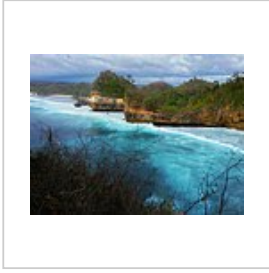
Pantai Batu Bengkung