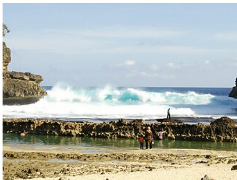
Pantai Batu Bengkung