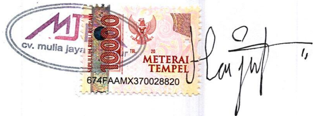
Hariyono Seputro, Y P