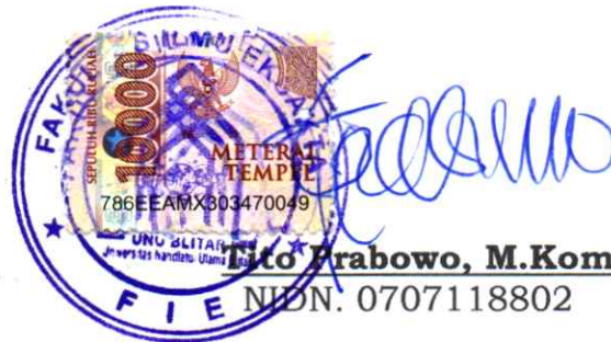
M. Kom NIDN. 0707118802

Universitas Nahdlatul Ulama Blitar Ketua Program Studi Ilmu Komputer Fakultas Ilmu Eksakta