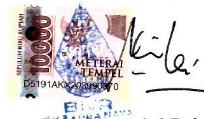
Rita Anggraini Rahayu