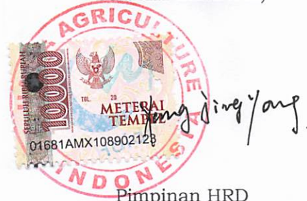
Pimpinan HRD Yang Jingyong