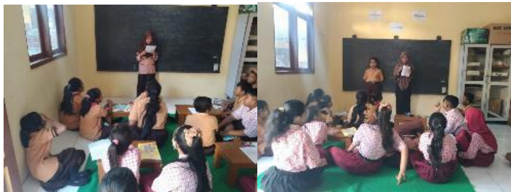
Membuat Media Pembelajaran Numerasi