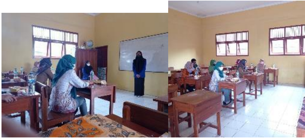
Perkenalan Diri dengan Siswa