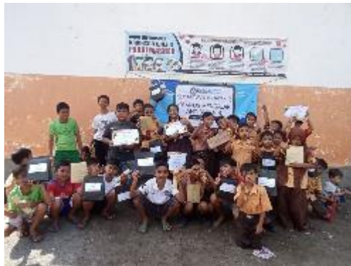
Persiapan Pelaksanaan AKM Kelas