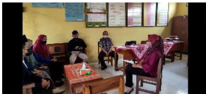
Membantu Merekapitulasi Nilai