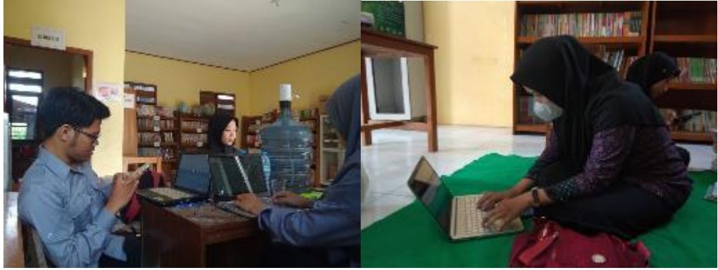
Membuat Pamflet Donasi Buku