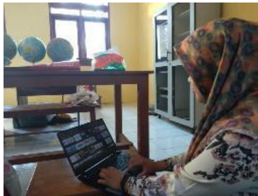
Membantu Pelaksanaan Pondok Romadhon