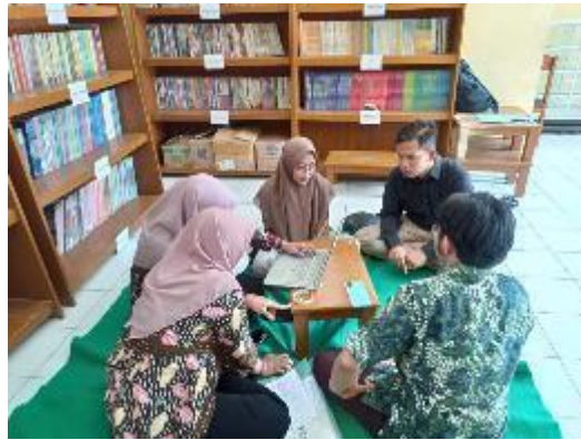
Membantu Pelaksanaan PTS dan Ujian Semester