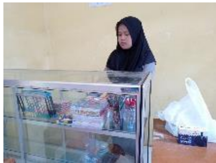
Membersihkan Gudang, Alat Peraga, dan Fasilitas