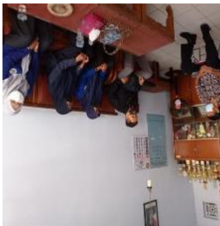
Kunjungan ke SD N Padangan 3