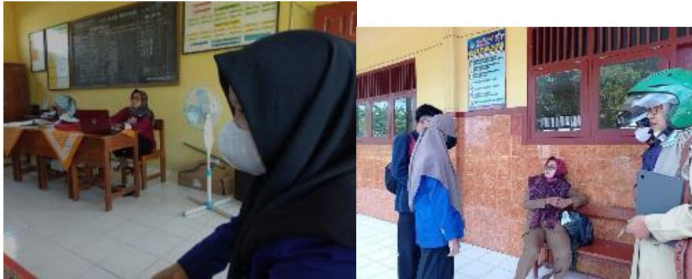
Halal Bihalal dengan kepala sekolah, guru, dan siswa SD N Padangan 03