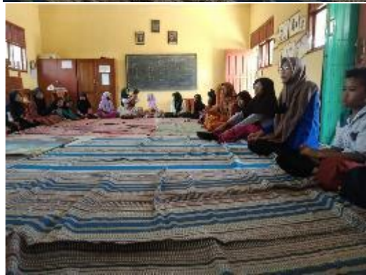
Forum Diskusi dan Komunikasi