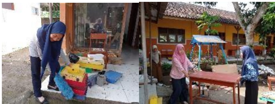
Persiapan Lomba Akademik dan Non-akademik