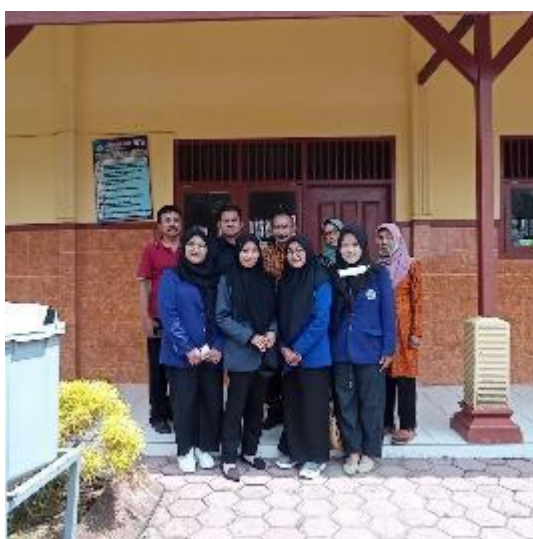
Pembukaan/Penerimaan Mahasiswa Kampus Mengajar di SD N Padangan 3