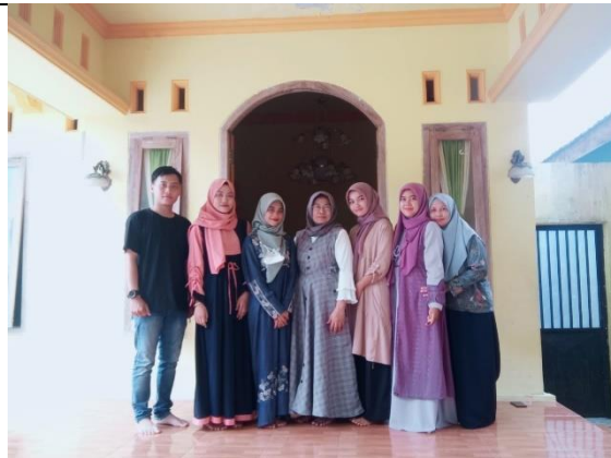
Acara Pelepasan Kelas VI