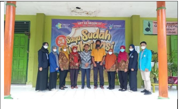
Penerimaan Mahasiswa Kampus Mengajar dan Observasi Awal