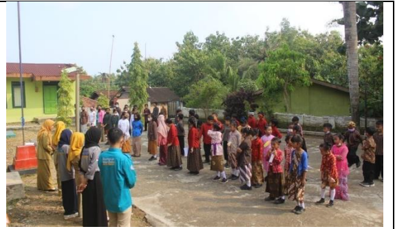
Peringatan Hari Kartini