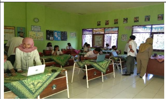
Ujian Akhir Kelas VI