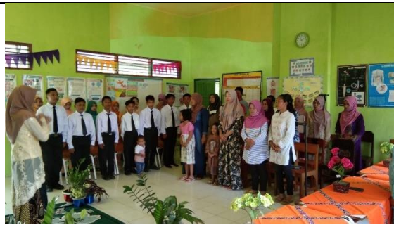
Sharing Session bersama DPL