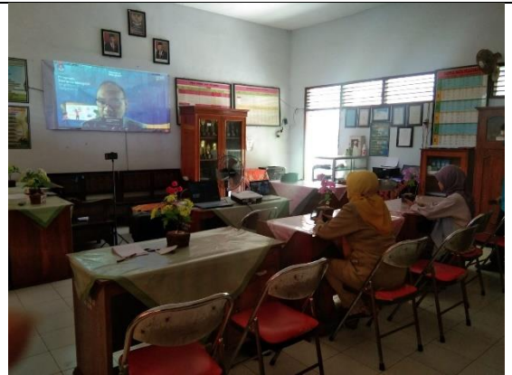
Pretest AKM kelas