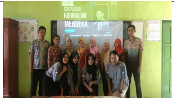
Sosialisasi AKM Kelas