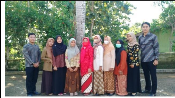
Peringatan Hari Pendidikan Nasional