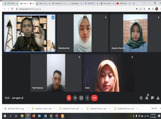
Penyerahan hadiah acara Peringatan hari Kartini