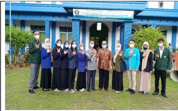
Perizinan kepada Korwil Kecamatan Wonotirto