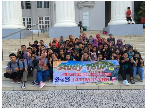
Sosialisasi Kurikulum Merdeka