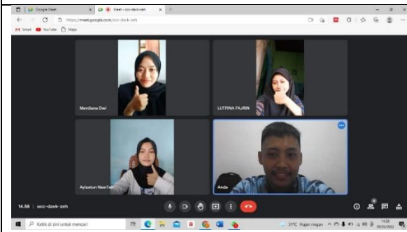
Diskusi Minggu Pertama Observasi