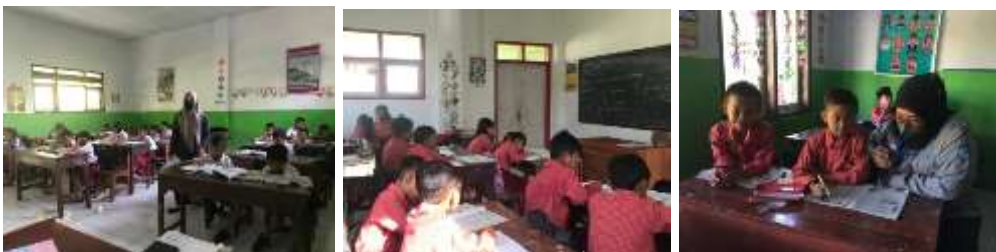
Kegiatan belajar mengajar