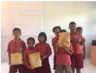
Pemberian hadiah classmeeting