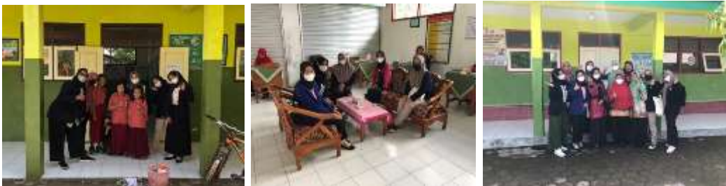
Melakukan kunjungan ke sekolah sebelum penerjunan