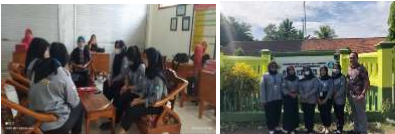
Pamit kepada Kepala Sekolah serta Dewan Guru saat Penarikan Mahasiswa yang dihadiri oleh Pembimbing Dosen Lapangan