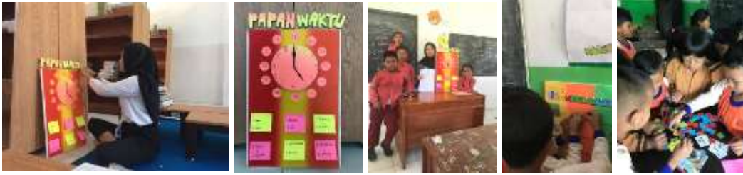
Membuat media pembelajaran