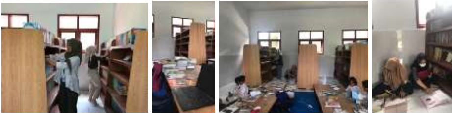
Pengklasifikasian jenis buku , mengkode buku dan menata buku