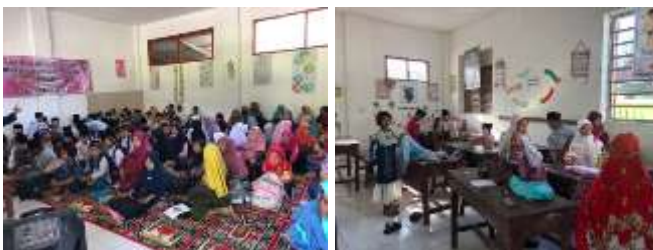
Kegiatan pondok ramadhan