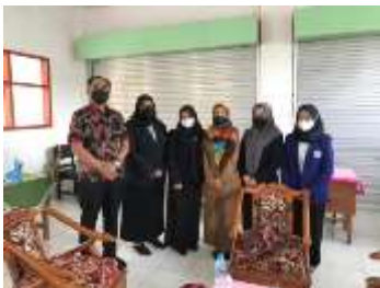
Penerjunan mahasiswa di sekolah sasaran dengan didampingi Dosen Pembimbing Lapangan