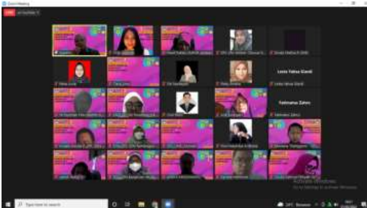
Zoom dengan Dinas Pendidikan Kabupaten Jember