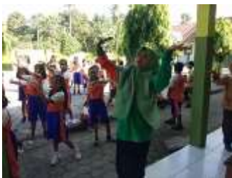
Senam sehat "wes wayahe"