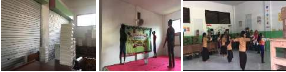
Prepare acara perpisahan / wisuda