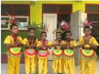
Acara wisuda dan penampilan tari kreasi