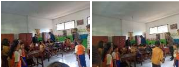
Sosialisasi hidup sehat