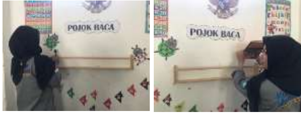
Pemasangan rak pojok baca