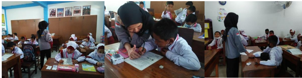
Membantu Absensi UTS dan PAS