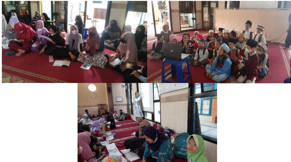
Mengawasi dan Mendampingi UTS dan PAS