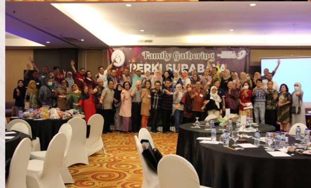
FAMILY GATHERING 2022