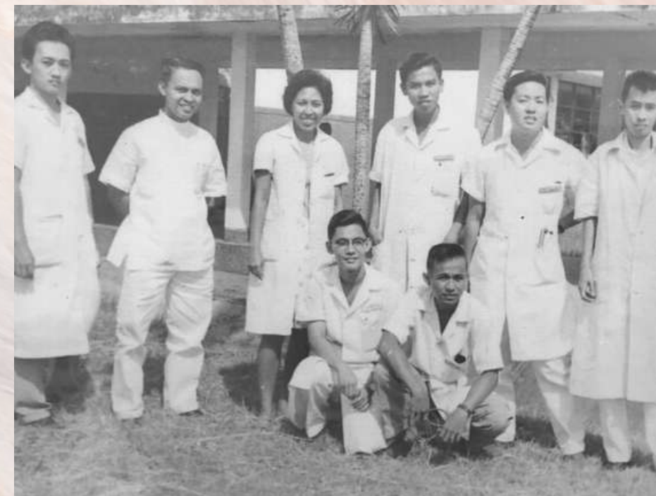
KEGIATAN PRAKTIS KLINIS DAN PENDIDIKAN DI KARDIOLOGI TEMPO DULU