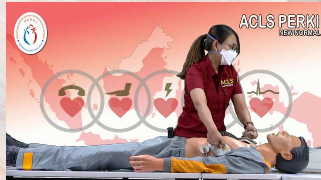
ACLS 2021 (ONLINE)