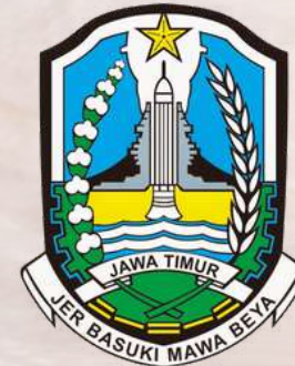
PEMERINTAH DAERAH PEMROV JATIM