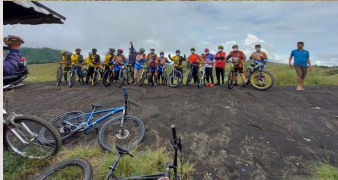
BANYUWANGI FUNBIKE 2019