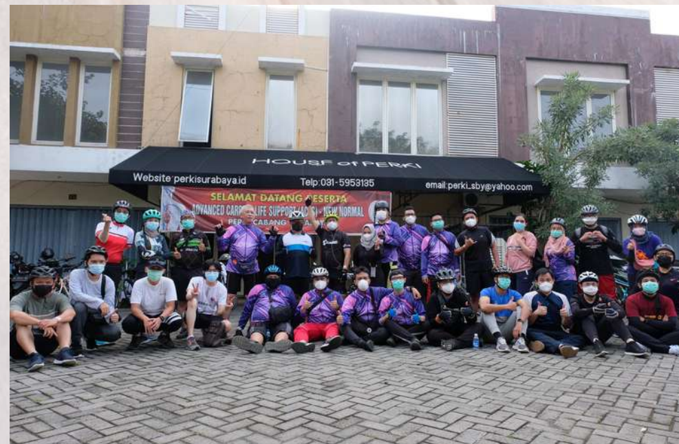
HOUSE OF PERKI SURABAYA JL. MANYAR JAYA II