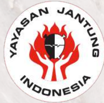
YAYASAN JANTUNG INDONESIA