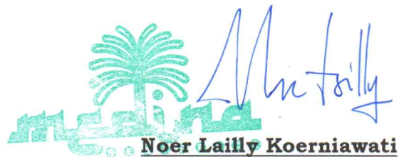
Noer Lailly Koerniawati