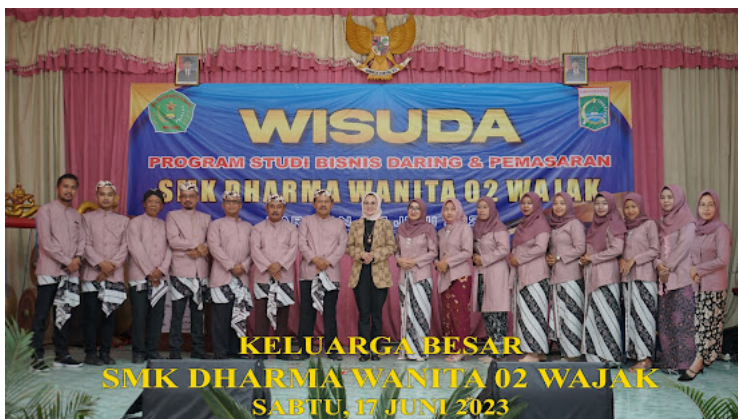
FOTO ACARA WISUDA SMK DHARMA WANITA 02 WAJAK TAHUN 2023